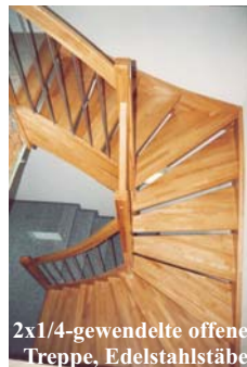
2x1/4-gewendelte offene Treppe, Edelstahlstäbe