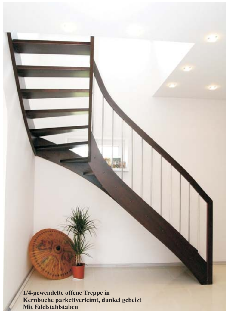
1/4-gewendelte offene Treppe in Kernbuche parkettverleimt, dunkel gebeizt Mit Edelstahlstäben