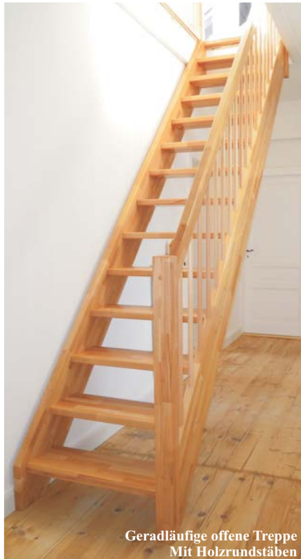
Geradläufige offene Treppe Mit Holzrundstäben

Handwerkliche Maßanfertigung aus Massivholz nach DIN 18334. Hergestellt in Deutschland. Beidseitig eingestemmte Wangentreppe. Stufen-, Wangen- und Handlaufstärke ca. 40 mm. Geländer aus glatten Holzrundstäben Ø ca. 25 mm oder Edelstahlstäben Ø ca. 16 mm, glatten An- und Austrittspfosten ca. 80 x 80 mm oder 80 x 40 mm und glattem Holzhandlauf ca. 80 x 40 mm. Offene Ausführung, ohne Setzstufen. Treppenbreite bis 95 cm. Auftrittsbreite bis 26 cm. Alle Holzteile werden sauber geschliffen und oberflächenfertig versiegelt.