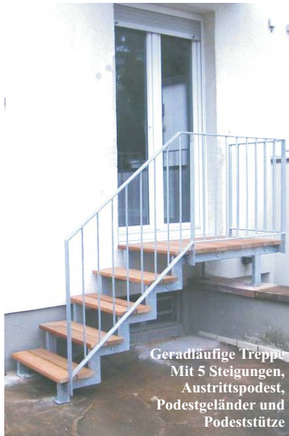
Geradläufige Treppe Mit 5 Steigungen, Austrittspodest, Podestgeländer und Podeststütze