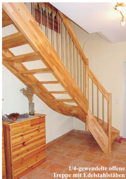
1/4-gewendelte offene Treppe mit Edelstahlstäben

Preise für eine komplette Treppe in Kernbuche parkettverleimt, incl. 19% MwSt. Incl. Aufmaß, Lieferung und Montage im 50 km-Umkreis von Frankfurt /M.