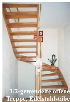
1/2-gewendelte offene Treppe, Edelstahlstäbe